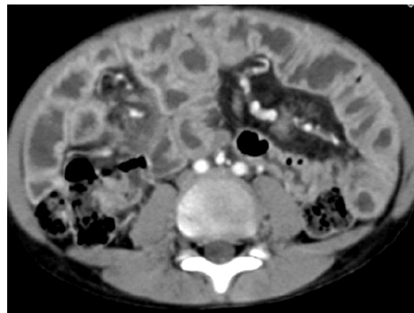
Fig. 2. Abdominal CT finding: Diffuse small bowel wall thickenings of entire small bowel levels with relatively spared large bowel wall. Small amount of reactive fluid.