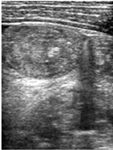
Fig. 1. Abdominal ultrasonographic finding: Diffuse small bowel wall thickenings of entire abdomen with abnormal hypoechoic mesenteric thickening and infiltrations of entire small bowel mesentery with enlarged mesenteric lymph nodes.

방사선 검사 소견: 흉부방사선 검사상 심비대는 없었으며 흉막액의 소견은 보이지 않았다. 복부초음파 검사상 소량의 복수가 관찰되었고 전체적으로 소장벽의 두께가 증가되어 있었다(Fig. 1). 수차례의 알부민 투여 후 음낭 수종은 소실되었으며, 음낭 초